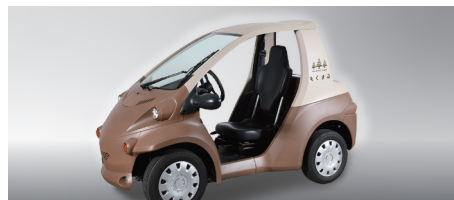
もくまる トヨタ車体株式会社