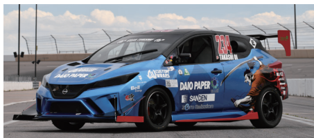
SAMURAI SPEED 大王製紙株式会社