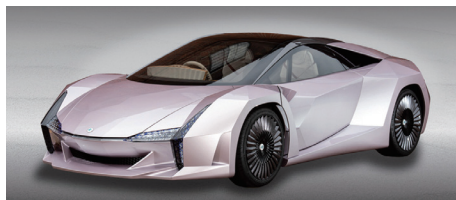
ナノセルロースヴィークル 環境省